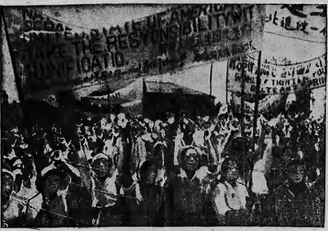
OUDE VROUWEN demonstreerden in grote getale tegen de voorgenomen bestandsvereenkomst. De oproep van Rhee om geen demonstraties te houden, had niet het minste resultaat en volgens de Regering zouden de dagelijkse demonstraties een geheel spontaan karakter hebben. Waarnemers hopen dat het leger minder fanatiek is dan de burgerbevolking, zodat indien het tot een bestand mocht komen de lust tot doorvechten toch niet al te groot zal zijn.